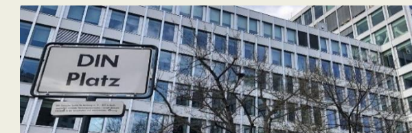
Deutsches Institut für Normung