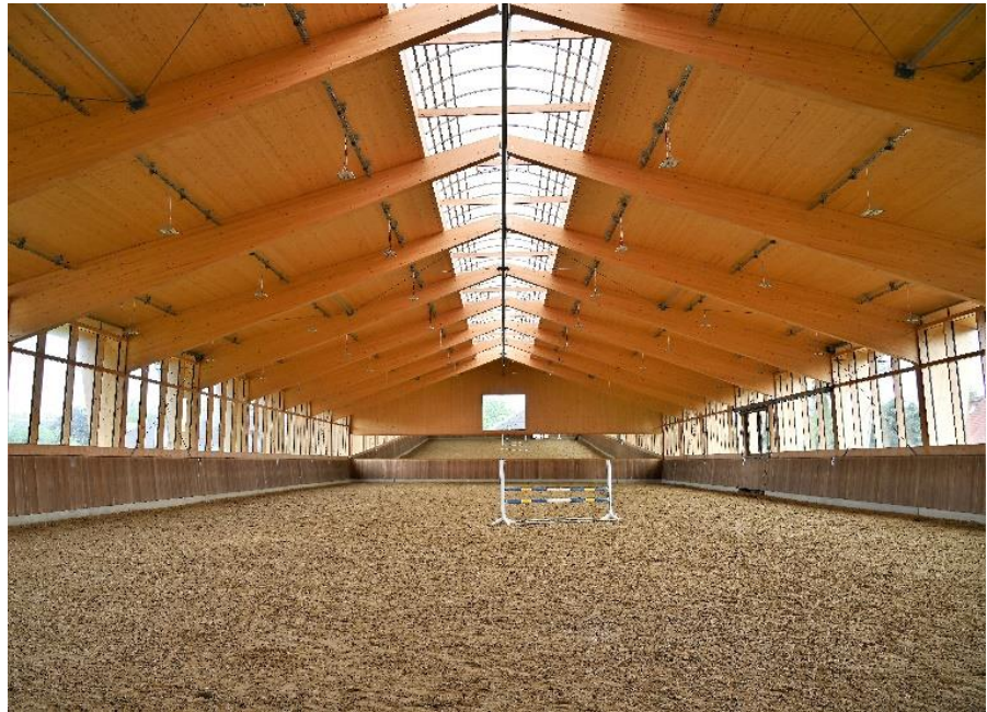
Bilder 1a und 1b: