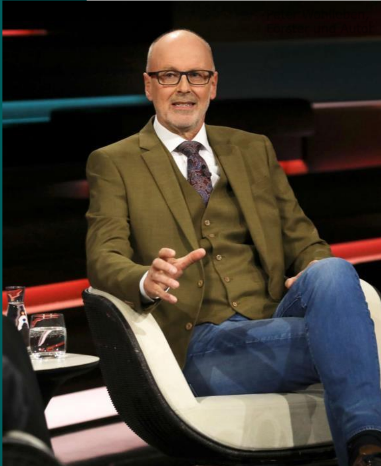
Peter Wohlleben, Förster und Autor